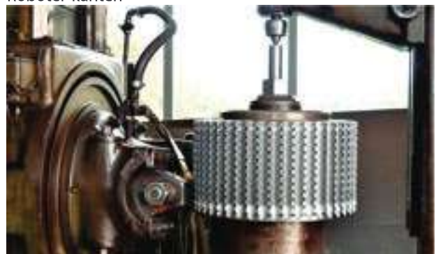
Herstellung von Kettenrädern