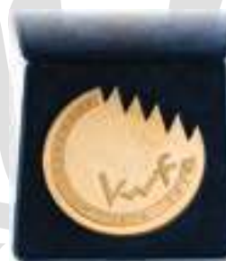
KWF Innovationspreis 2016