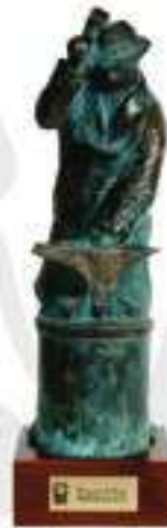
Handwerker des Jahres 2005

Die positiven Rückmeldungen unserer Kunden, die mit hoher Zufriedenheit und großem Vertrauen die Produkte von KRPAN verwenden, beweisen, dass wir ein zuverlässiger Partner sind, was wir auch in Zukunft bleiben wollen – zuverlässig „stärker“ .