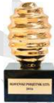
Unternehmer des Jahres 2016