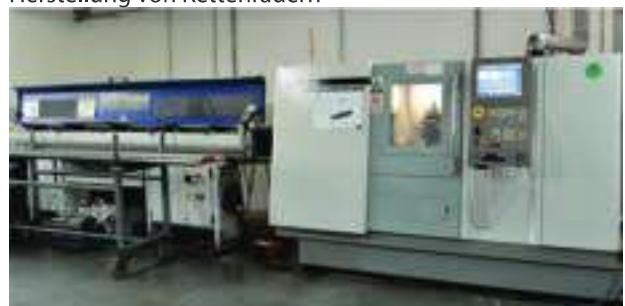
CNC-Fräsen, - Drehen